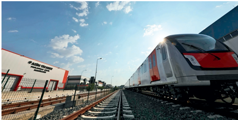
暖阳下等待交付的列车

在那半个月里，陪伴家人之余我抓紧一切时间做着出国的准备，也对土耳其进行了系统的了解，才发现原来理想中浪漫的土耳其在现实中却有点残酷。土耳其在 2016 年下半年发生了军事政变，国内政局不太稳定，军事行动还在继续，恐怖袭击时有发生。但调令已经下发，硬着头皮也得去啊！